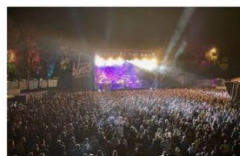
Sierre Blues Festival