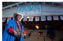
Teddy's Juke Joint