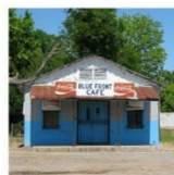
Blue Front Cafe